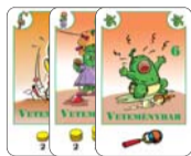
6 veteménybab (4 F, 1 L, 1 B)