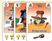
21 tarkabab (11 F, 5 L, 5 B)