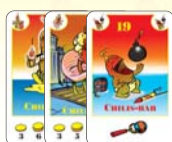
19 chilis-bab (10 F, 4 L, 5 B)