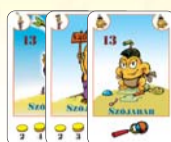
13 szójabab (8 F, 2 L, 3 B)