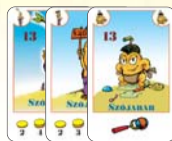
13 szójabab (8 F, 2 L, 3 B)