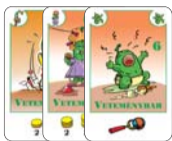
6 veteménybab (4 F, 1 L, 1 B)