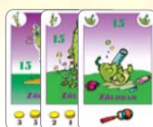
15 zöldbab (9 F, 3 L, 3 B)