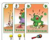
6 veteménybab (4 F, 1 L, 1 B)