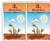
2 kártya „3. babföld”

A rövidítések: F = Férfi, L = Lady, B = Bébi