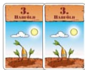
2 kártya „3. babföld”

A rövidítések: F = Férfi, L = Lady, B = Bébi