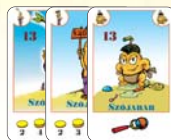
13 szójabab (8 F, 2 L, 3 B)