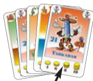
Minden játékos 5 lapot kap a kezébe. Ez az első lap!

Figyelem! A játékosok a kézbe kapott lapok sorrendjén nem változtathatnak , a lapokat nem válogathatják egymás mellé fajtánként, ahogy ez más kártyajátékokban engedélyezett. Ez azt jelenti, hogy a játékosoknak a lapokat úgy kell a kezükben tartani, ahogy azt az osztó játékos kiosztotta. A játék során is az új lapokat minden esetben a régiéik mögé kell illeszteni. Az osztó játékos a maradék lapokból egy lefordított (tallér oldalával felfelé) paklit („húzó-pakli”) képez az asztalon. A játékosok választanak egy kezdő játékost.