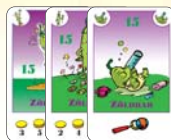
15 zöldbab (9 F, 3 L, 3 B)