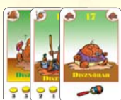
17 disznóbab (9 F, 4 L, 4 B)