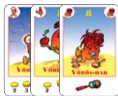
8 vörös-bab (5 F, 1 L, 2 B)