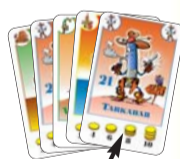
Minden játékos 5 lapot kap a kezébe. Ez az első lap!

Figyelem! A játékosok a kézbe kapott lapok sorrendjén nem változtathatnak , a lapokat nem válogathatják egymás mellé fajtánként, ahogy ez más kártyajátékokban engedélyezett. Ez azt jelenti, hogy a játékosoknak a lapokat úgy kell a kezükben tartani, ahogy azt az osztó játékos kiosztotta. A játék során is az új lapokat minden esetben a régiek mögé kell illeszteni. Az osztó játékos a maradék lapokból egy lefordított (tallér oldalával felfelé) paklit („húzó-pakli”) képez az asztalon. A játékosok választanak egy kezdő játékosat.