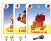
8 vörös-bab (5 F, 1 L, 2 B)