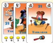
21 tarkabab (11 F, 5 L, 5 B)