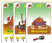
17 disznóbab (9 F, 4 L, 4 B)