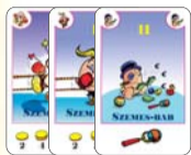
11 szemes-bab (7 F, 2 L, 2 B)