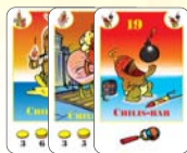
19 chilis-bab (10 F, 4 L, 5 B)