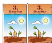
2 kártya „3. babföld”

A rövidítések: F = Férfi, L = Lady, B = Bébi