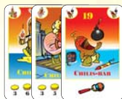
19 chilis-bab (10 F, 4 L, 5 B)