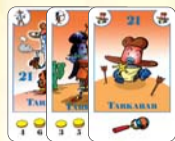
21 tarkabab (11 F, 5 L, 5 B)