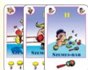
11 szemes-bab (7 F, 2 L, 2 B)