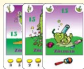
15 zöldbab (9 F, 3 L, 3 B)