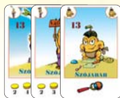
13 szójabab (8 F, 2 L, 3 B)