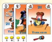
21 tarkabab (11 F, 5 L, 5 B)