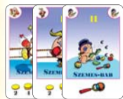
11 szemes-bab (7 F, 2 L, 2 B)