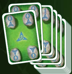
20 játékgura 4 színben