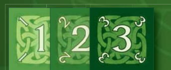
7 pontlapka (2 x „1”; 3 x „2”; 2 x „3” értékkel)