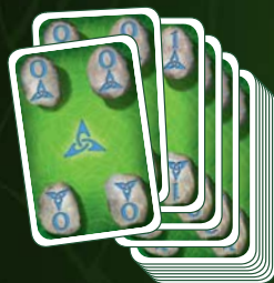
20 játékgura 4 színben