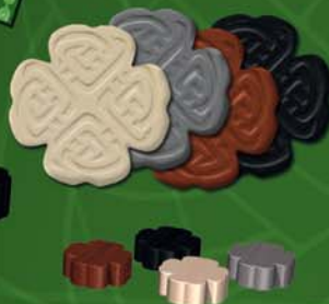
4 pontjelző kő