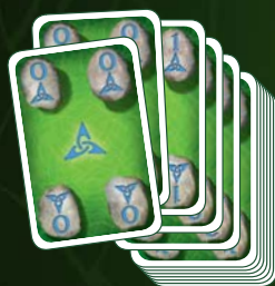
20 játékgura 4 színben